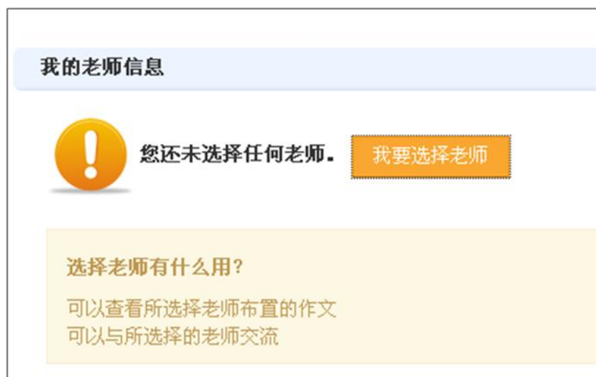
图表 27 学生个人信息页面可选择老师