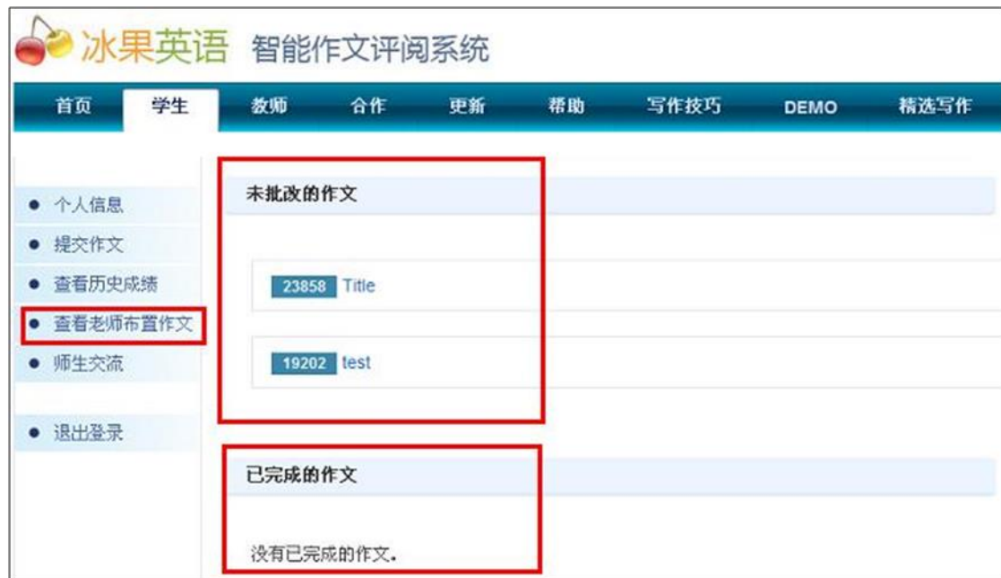
图表 37 显示老师所有已批改和未批改的作文，通过点击未批改作文的序列号，可以提交作文