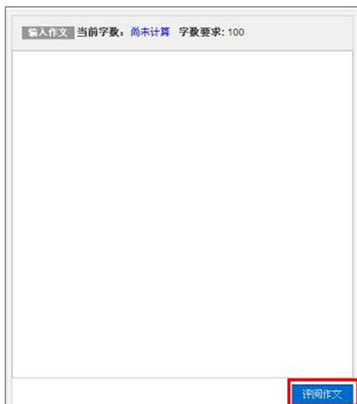
图表 30 查询到作文后，在作文提交页面输入正文，然后提交