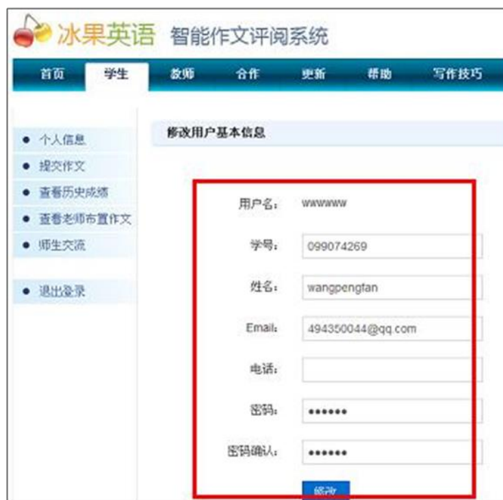
图表 26 更改个人信息：姓名、密码和联系方式