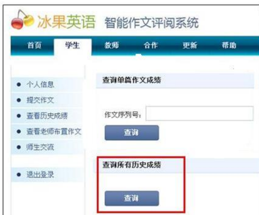
图表 35 点击“查询”，可查询所有的作文的历史记录