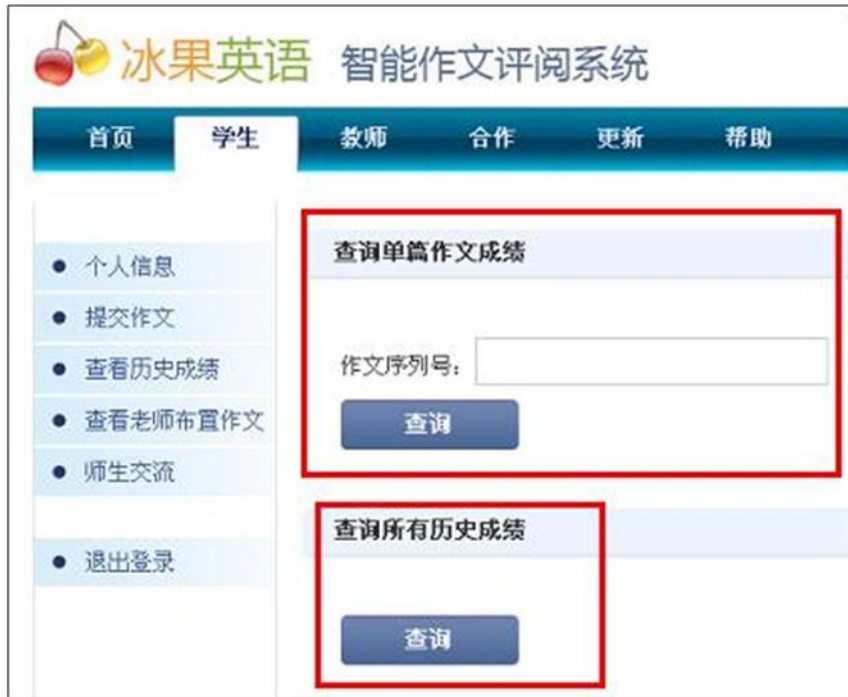
图表 33 点击“查看更多”后，可以通过序列号查看单篇已提交作文的具体情况