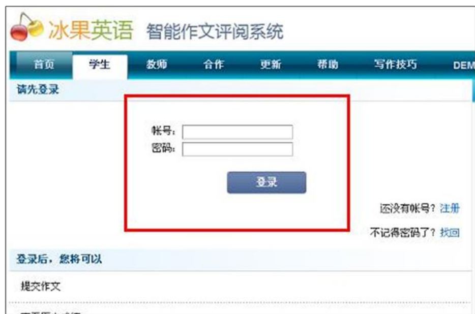
图表 24 在学生页面输入账号和密码，登录系统