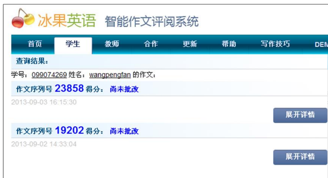
图表 36 找到所有的历史成绩