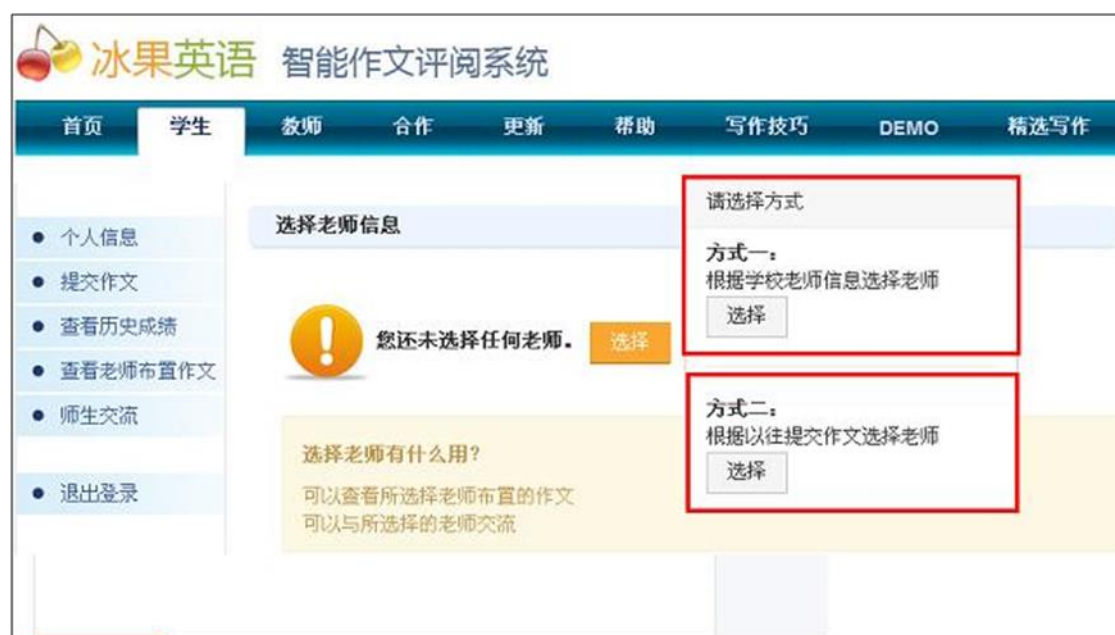
图表 28 通过学校老师信息和以往提交作文两种方式选择老师