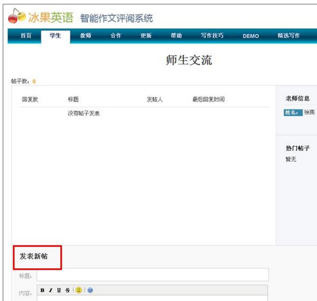
图表 38 学生可以在线向老师提问或者交流，并可以同时看到其他同学与老师的交流情况