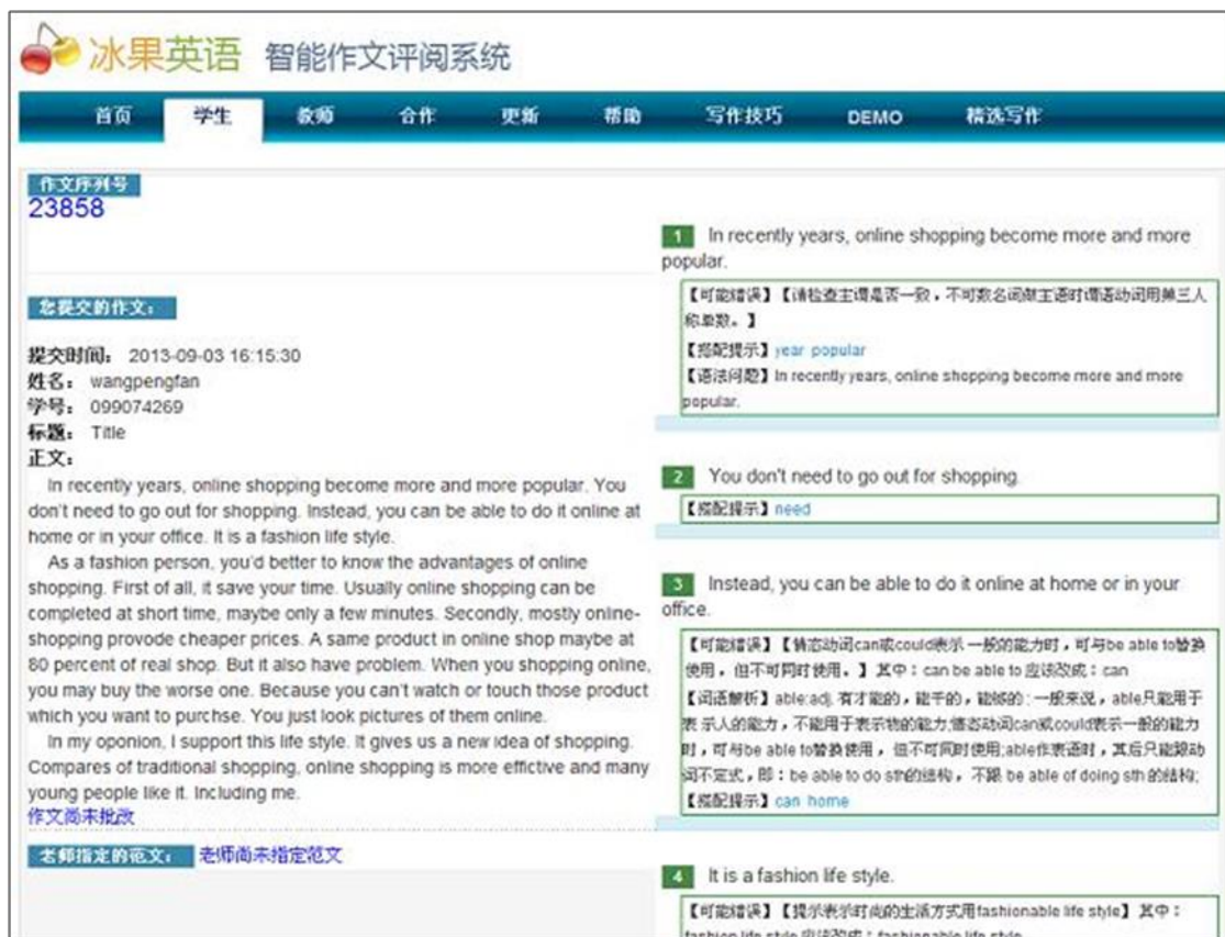
图表 34 通过序列号查询已提交的作文的具体情况