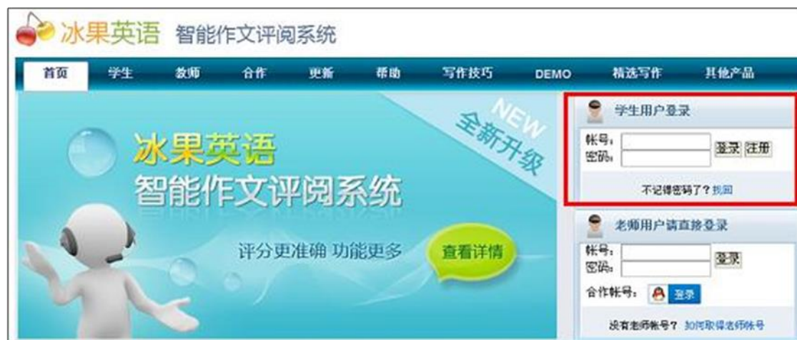
图表 23 在首页输入账号和密码，登录系统